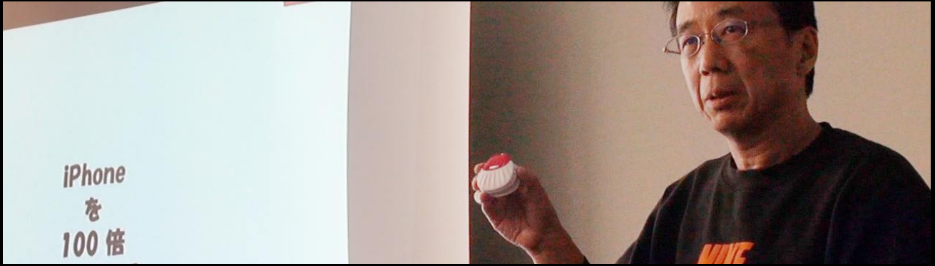
松井会員による iPhone ストロボ撮影の実際の発表

研究講座：「カメラ RAW のプリセット」：平野正志講師 会員発表：松井秀樹会員による「iPhone ストロボ撮影の実際」 “ライトニングトーク” 希望者各自 3 分 動画技術講座「Photoshop での動画 Log 調整」：高木大介 講師