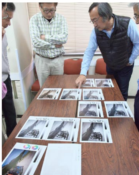
今月の1枚：ダブルトーンのプリント検証中