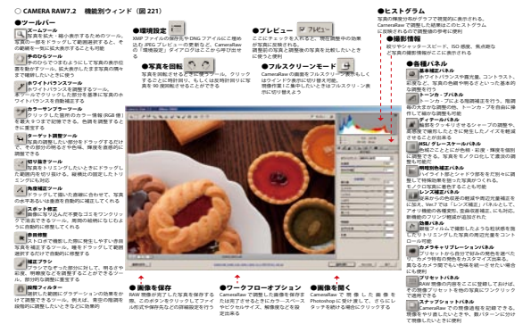
高木大輔講師の労作、CmameraRAW の主要メニューが一目で分かる「CAMERA RAW 機能別ウィンド」