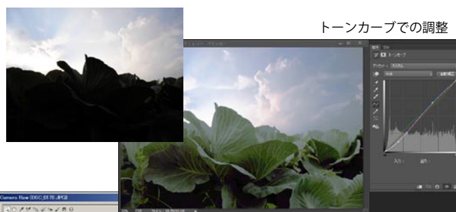
トーンカーブでの調整