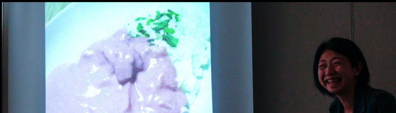
ライトニングトーク：食品の色変更で笑いをとる KN 会員

Digitable 基礎講座「トーンカーブの調整②調整の実際」：高木大輔講師 参加者全員による“ライトニングトーク”（持ち時間 4 分） Photoshop 研究講座「色調補正の白黒を検証する」：平野正志講師