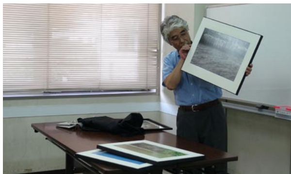
今月の 1 枚：11 月の展覧会に向けての検討用に額縁サンプルを持参してくれた I F 会員

***** DIGITABLE 写真技術勉強会 不許複製 (C) Digitable.info. 20150623 All Rights Reserved *****