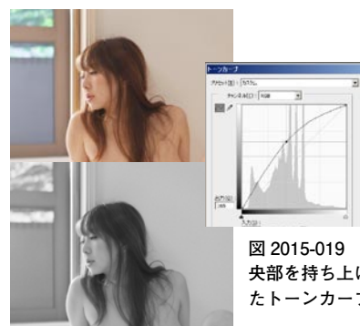
図 2015-019 中央部を持ち上げたトーンカーブ