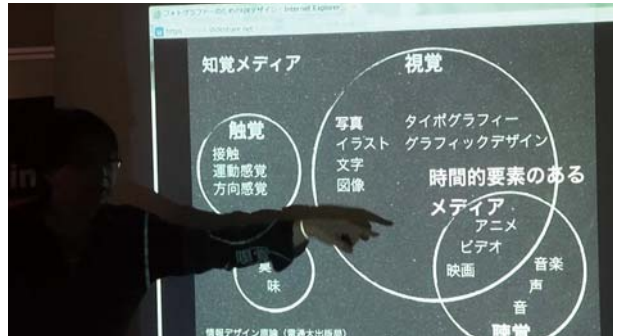
知覚メディアの 카테고리について解説する白澤会員