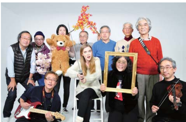
今月の 1 枚：2015 年 12 月に行われたモデル撮影会