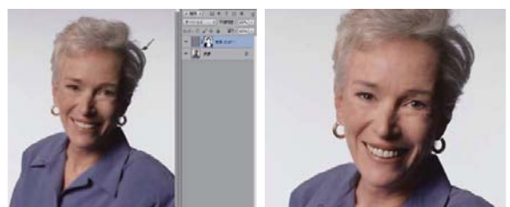
適度にキメが残った美肌に修正